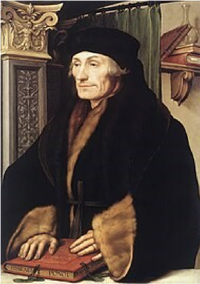
Erasmus da Rotterdam (1466 - 1536)

E uropean R egion A ction S cheme for the M obility of U niversity S tudents