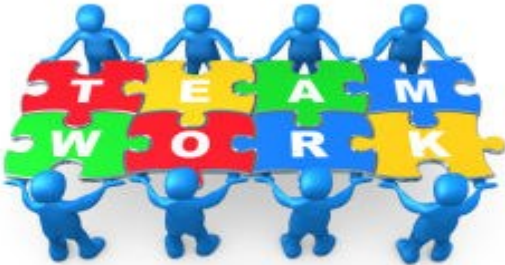
Lavori di gruppo